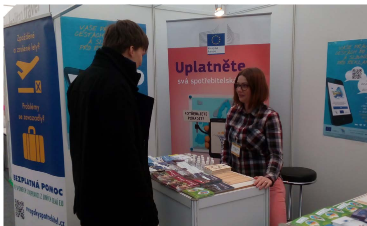
ESC poskytuje informace o právech spotřebitelů při cestování v Evropě návštěvníkům veletrhů cestovního ruchu.